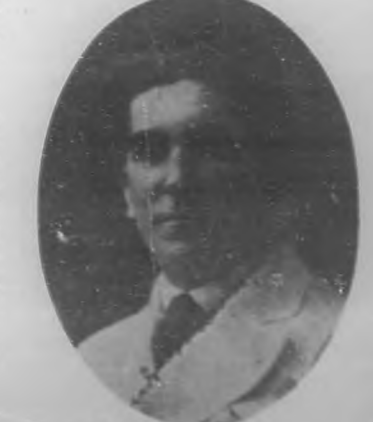
RICARDO SEVILLA Tenor que por sus bellas facultades y la firmeza de carácter está considerado como el Schiops cubano.