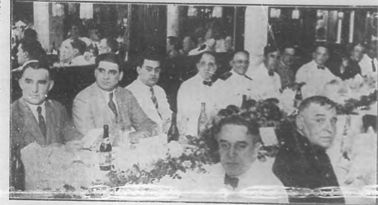
LAS BODAS DE PLATA DE LA BANDA MUNICIPAL.—Presidencia del almuerzo celebrado en el hotel "Saratoga" para conmemorar el 25° aniversario de la fundación de la Banda Municipal.

El día del inválido. Ayer sábado, como estaba anunciado, se llevó a efecto la piadosa obra caritativa de la cuestación "Día de los inválidos".