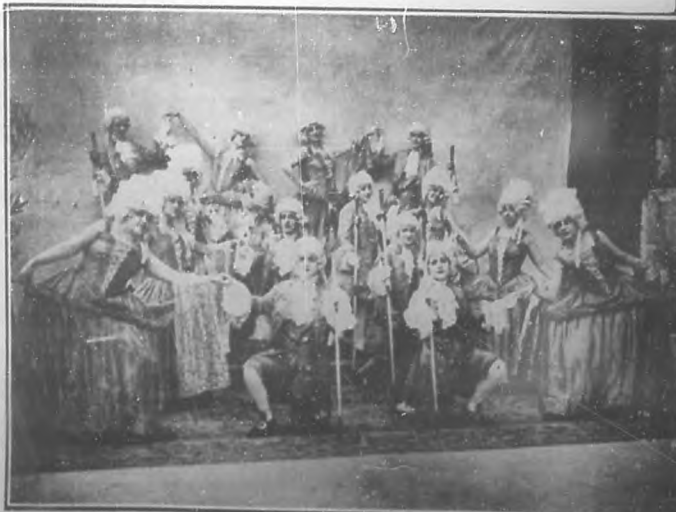
"La fiesta Veracruzana", una de las escenas más movidas y sugestivas de "La danza de las libélulas".

Anckermann y Noriega han sido colaboradores utilísimos de Villoch, aquí, poniendo a "El peligro chino" una música ligera, inspirada y agradable; y el otro, pintando para "El peligro chino" un decorado precioso. Además, esa revista será presentada lujosamente. Los artistas de Regino, por