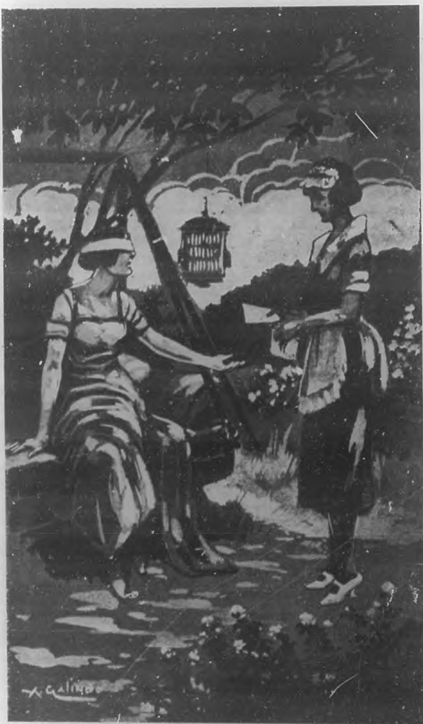
Tenia los ojos vendados, la luz solar que a torrentes caía en la gloria exuberante de la Primavera, no hería sus pupilas cerradas para siempre...