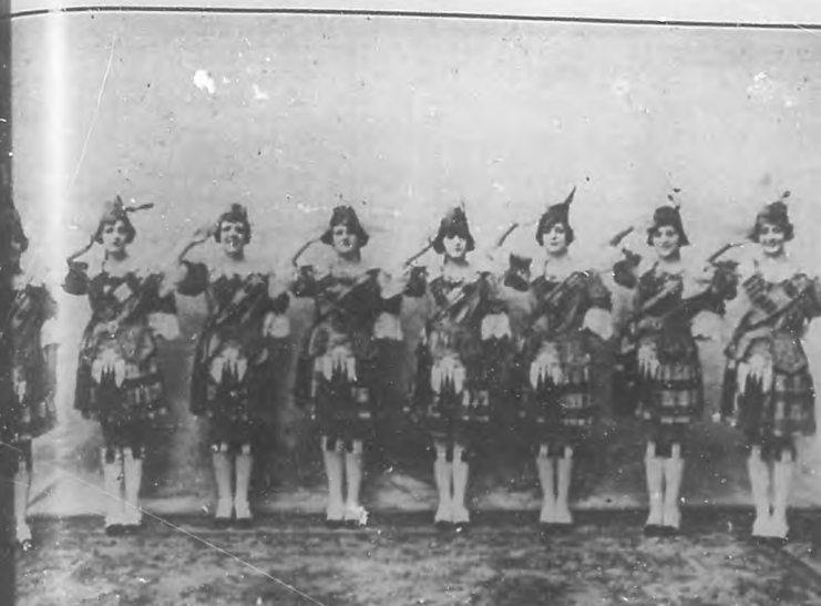
Grupo de "Las Escocesas", número muy interesante de "La danza de las libélulas", que gustará mucho al público.