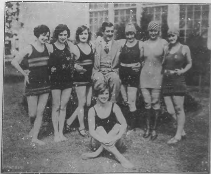
Hcbart Henley y su bellísimo grupo de bañistas que forman el conjunto de bellas acuáticas de "Free Love".

City, entabló há poco un pleito ante los tribunales del distrito contra la casa Paramount pidiendo indemnización de un millón de dólares más o menos, porque declara que es hija de James Briger, famoso exporador de otras épocas y al cual se le acusa de haberse reubicado en la producción de James Cruze, "El Carromato". De lo que doña Virginia se queja es de que el personaje de la película aparece en ella como un bebedor de empuje y en posesión de una especie de harén integrado por mujeres apaches. Lo cual, según la quejosa, es una calumnia.