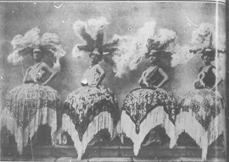
Grupo de "Abat Jours" de "La danza de las libélulas", en el que las vice tiple de "Martí" lucen su gracia y gentileza.

Según nos ha informado Rogelio Vara, el amable y diligente administrador de "Martí", ya quedan muy pocas localidades disponibles para la noche del estreno, el que será, sin duda alguna, un resonante acontecimiento artístico.